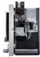
OPTIBEAN 2 (XL)