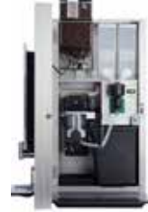
OPTIBEAN 3 (XL)