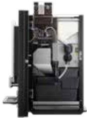
OPTIBEAN 2 (XL) TOUCH