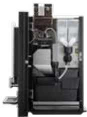
OPTIBEAN 3 (XL) TOUCH